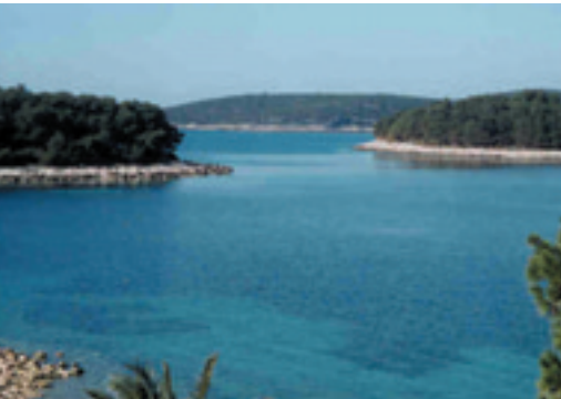
Ausblick von der Terrasse